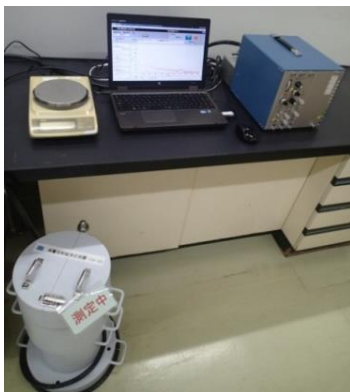
放射性物質検査装置

三陸産わかめは、行政や全漁連における継続的な放射性物質モニタリング検査が実施されておりますが、さらに万全を期すため、当社で調達した原料および製品について、放射性物質（セシウム-134、セシウム-137 検出限界：各 10Bq/kg）の自主検査を実施し、安全性を確認しております。